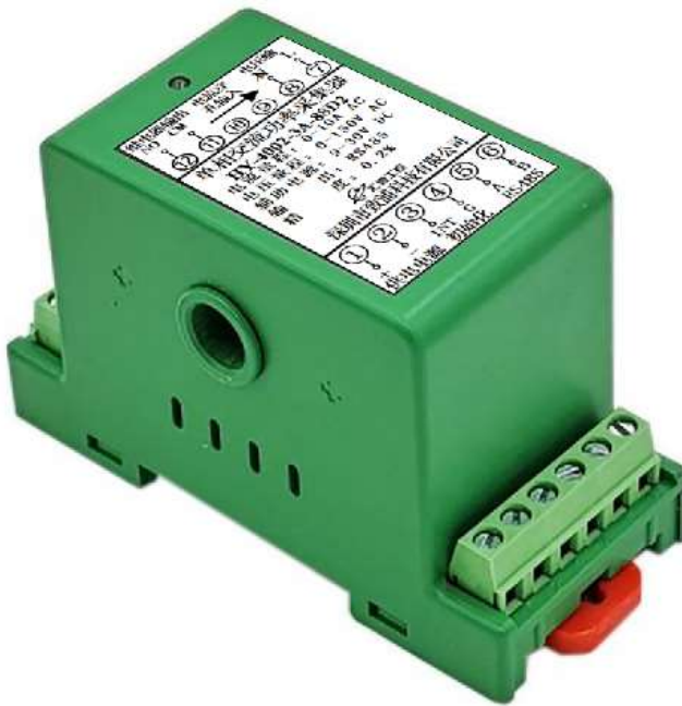
图 3.1、外观图（导轨安装）