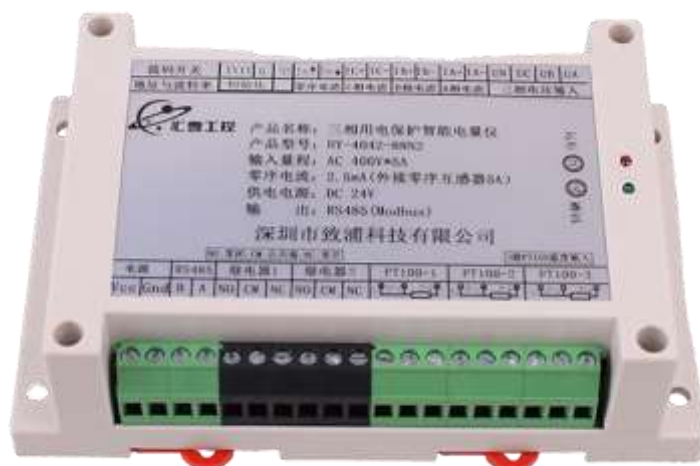
图一、产品实物图（导轨安装或螺钉）

外观尺寸：145X90X40 mm，螺钉安装尺寸,135X70mm，安装孔径 \phi 5mm