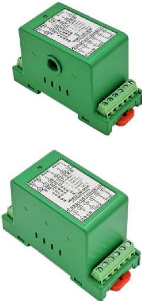
图 1：穿孔型外观（上图）端子型外观（下图）